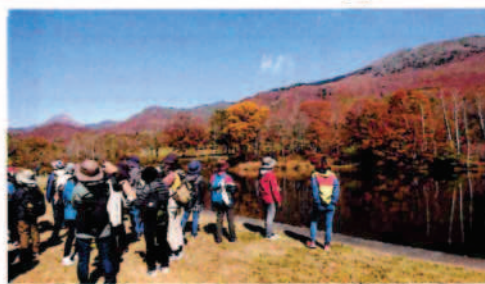
② 経験者コース 5km