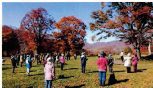
① 初心者コース 3km